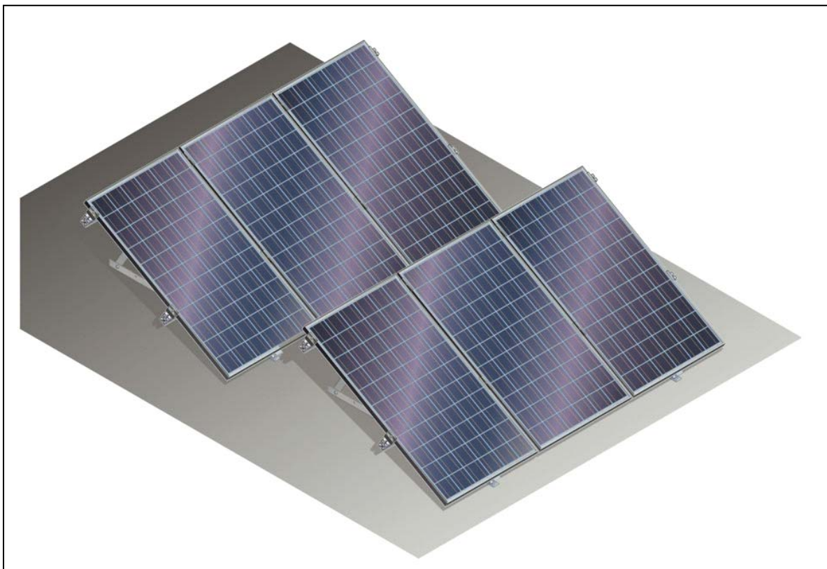
B - Module auf Flachdach - Zusammenbau