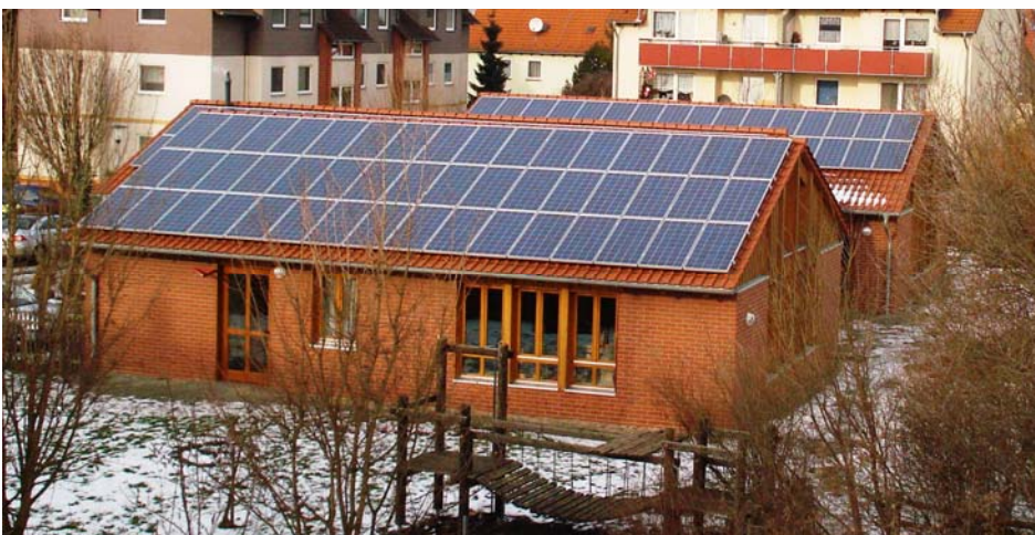
inutec-Gemeinschafts-Kaufanlage Kindergarten Inselweg in Schladen

Beim Betrieb einer Sonnenstromanlage gewinnen alle! Bitte rufen Sie uns für weitere Informationen an oder senden Sie uns eine Mail. Wir freuen uns auf Sie.